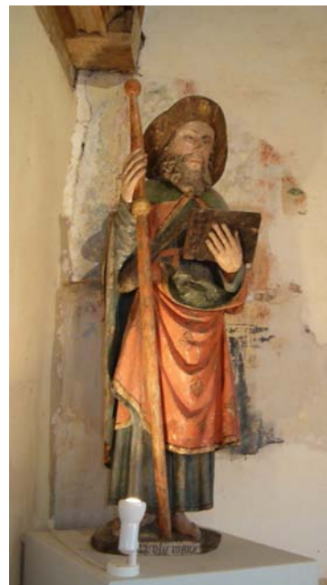
Jacques de Compostelle

Sans atteindre la foule d'un mois d'août au Mont Saint Michel, il faut dire sans exagération, que l'église n'a pas déserté pendant ces deux jours et la fraîcheur qui y régnait n'y était pour rien.